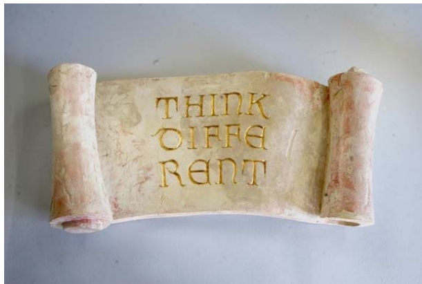
Pascal Häusermann, Think different , 2005