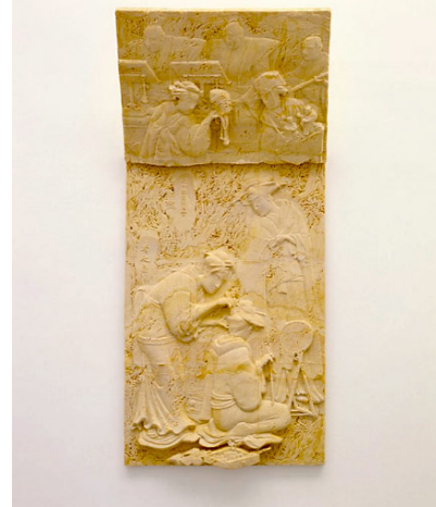
Giuseppe Gabellone, I Giapponese , 2003