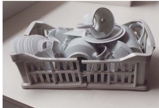
Anne et Patrick Poirier, Fragments de fouille , 1998