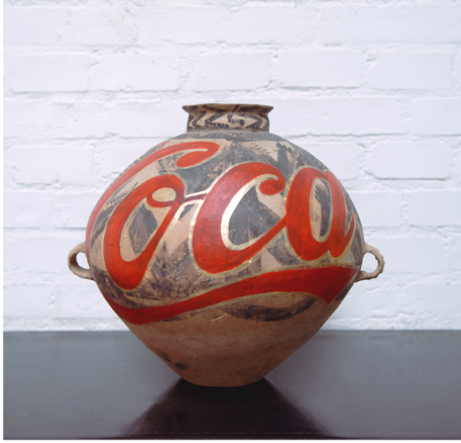
Ai Weiwei, Coca Cola , 2010