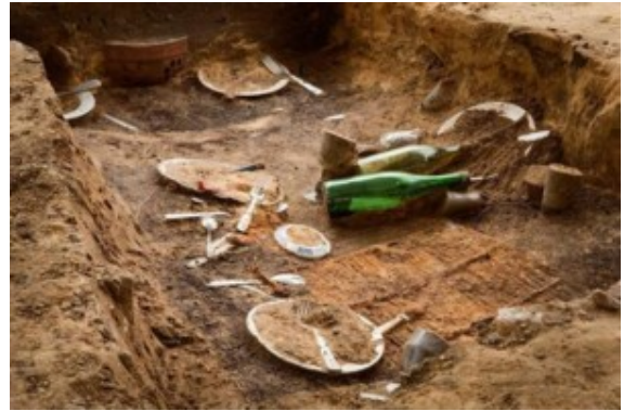
Daniel Spoerri, Déjeuner sous l'herbe , 1983/2010